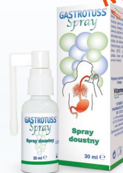
Spray doustny Dorośli i dzieci

Gastrotuss syrop przeciwrefluksowy, Gastrotuss tabletki do żucia przeciwrefluksowe, Gastrotuss light niskokaloryczny syrop przeciwrefluksowy, Gastrotuss baby syrop przeciwrefluksowy, Gastrotuss spray doustny przeciwrefluksowy.