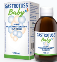
Syrop Dzieci i niemowlęta