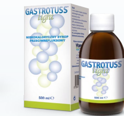
Syrop niskokaloryczny Dorośli i dzieci od 3. roku życia